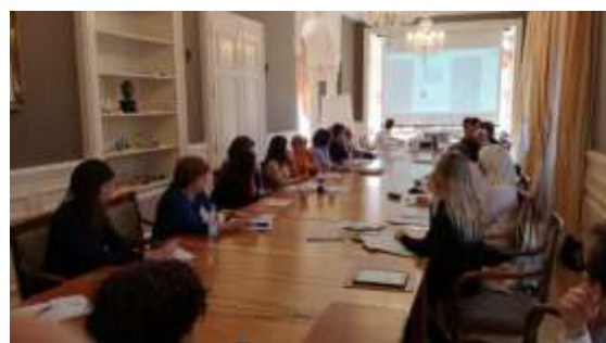
Reunión Anual de TGE (Ginebra, octubre de 2018)

En los últimos diez años, TGE ha canalizado más de 70 millones de euros . Durante 2017, TGE gestionó 4.844 donaciones internacionales (91,5% individuales y resto de empresas) a 350 entidades beneficiarias (20 recibieron más de 100.000 euros) por un importe total de más 10,5 millones